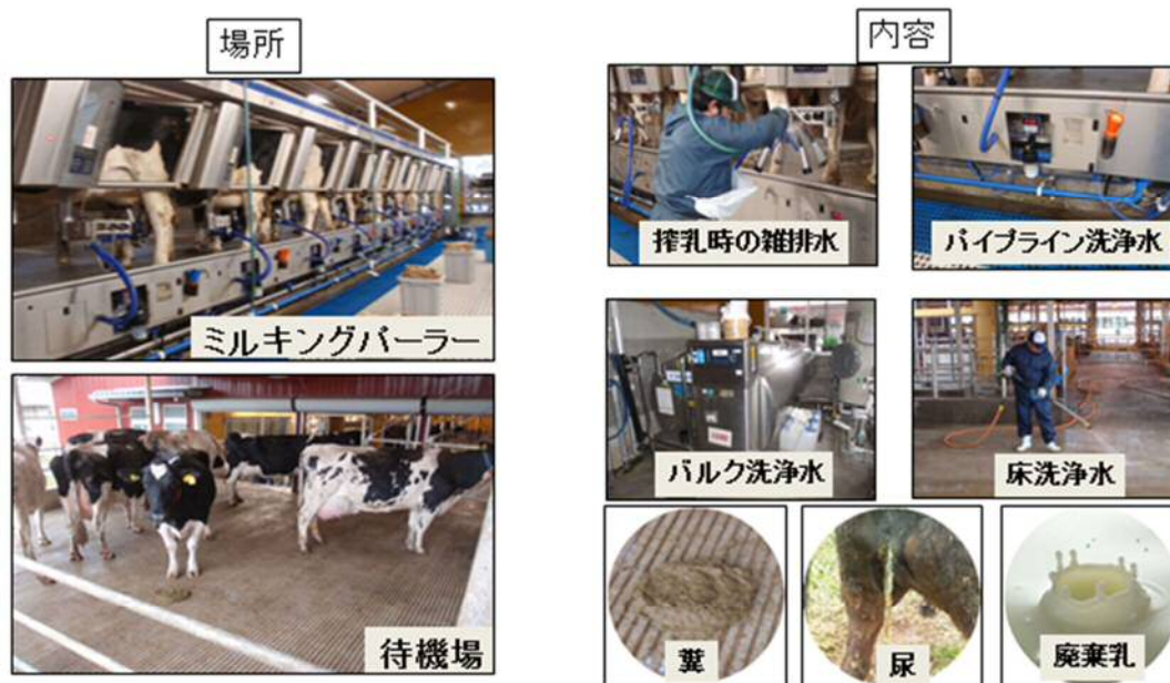
写真2 ミルクパーラー排水の量や性状に影響を及ぼす主要因例

が異なります。そこで、新たに施設を設計するために必要となる基準値(原単位)や管理指標の策定のため、排水処理施設実態調査の実施や水質のモニタリング手法について検討しています。