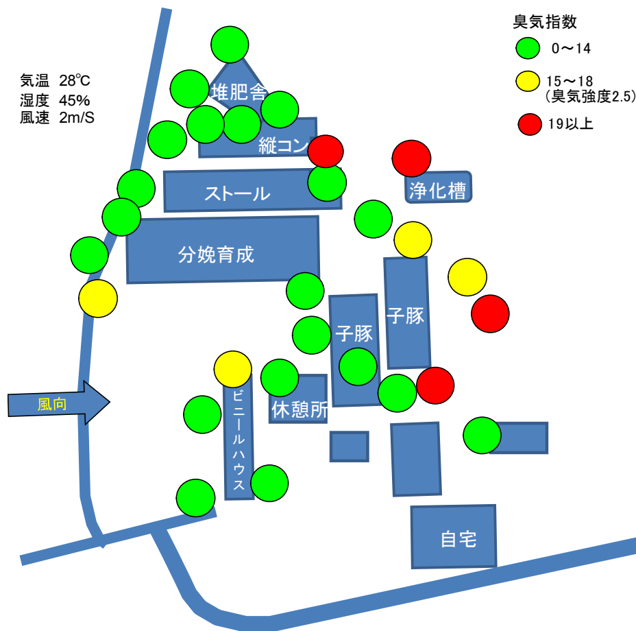
図3 臭気測定結果(イメージ図)

ニオイセンサの数値を農場マップ上に臭気指数ごとに色分け表示し、臭気の強い箇所が一目で分かるように図示します(図3)。