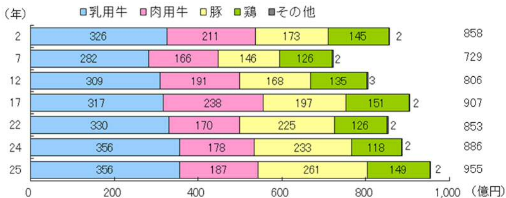
図2 畜種別畜産物農業産出額の推移 (農林統計)

※H3年から種鶏のみの飼養者及び成鶏めす300羽未満の飼養者を除く 豚及び鶏のH27年全国値はH26年値を記載。豚、採卵鶏のH22年値は農林業センサス値を、ブロイラーのH22年値はH21年値を記載。