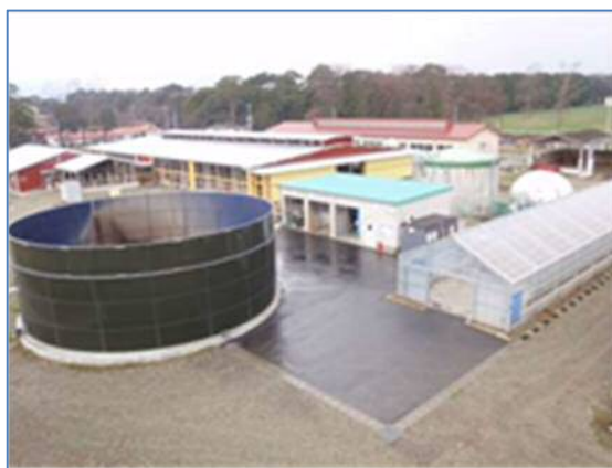
写真1 メタン発酵プラント実証施設と牛舎

畜産由来バイオマスのエネルギー利用の一環としてメタン発酵プラントの実証試験に取り組んでいます(写真1)。当該施設については、一般県民等の見学を積極的に受け入れており、畜産環境対策への取組に対する理解促進の一翼を担っています。