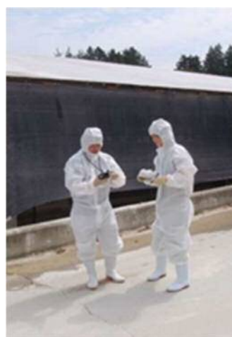
写真3 農場における畜環式ニオイセンサによる臭気測定

この手法は、前述した畜産臭気低減対策推進事業において、改善ポイントを重点化するためのツールとして活用されています。