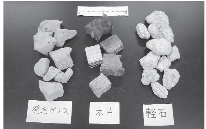
写真1 供試回収可能資材

り、軽石は低くなっています。どの資材もオガクズと比較すると吸水率は5～10分の1と低い値です。仮比重は発泡ガラスが低く、次が木片であり、軽石が高い値となっています。