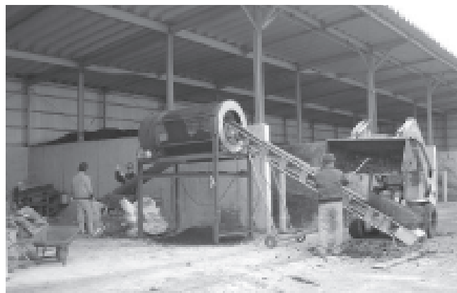
写真3 堆肥篩い分け作業

篩い分け成績を表3に示します。オガクズを使った堆肥は、900kgの乳牛ふんから849kg、2.2m 3 の堆肥ができました。一方、資材を混合して堆肥化し、堆肥化終了後篩い分けをすると、960kgの乳牛ふんから、発泡ガラスでは407kg、1.1m 3 の堆肥ができ、軽石では430kg、1.1m 3 、木片509kg、1.3m 3 の堆肥ができました。これは、オガクズを使った堆肥の約半分の量となりました。堆肥の水分はオガクズでは47.2%、資材では58~60%となり、資材でやや高く