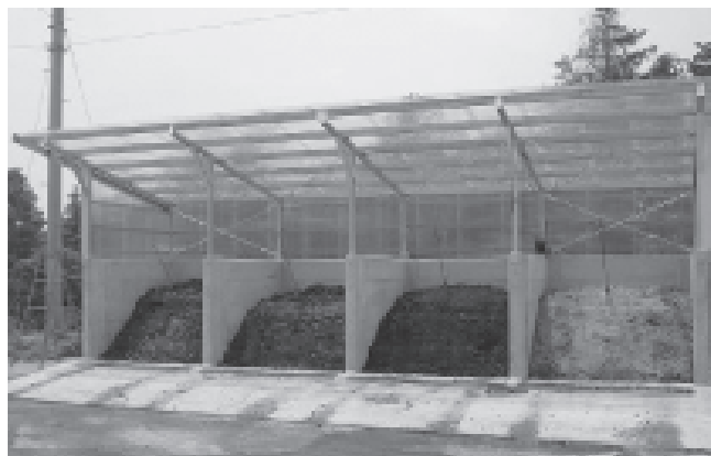
写真2 通気型堆肥化施設

度の最高温度、平均温度は、木片で、66.2℃、51.1℃、軽石で62.2℃、52.3℃、発泡ガラス大粒で53.9℃、46.6℃でした。資材を用いた堆肥化では、オガクズと比較すると最高温度、平均温度ともに低くなりました。資材の最高温度、平均温度は木片>軽石>発泡ガラスの順で低くなりました。