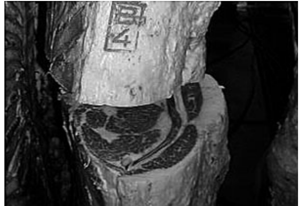
写真2 ウメビーフ 枝肉