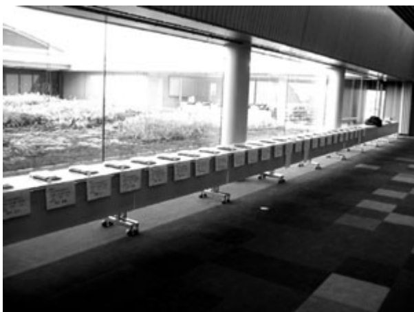
写真3 大阪府堆肥共励会に展示された家畜堆肥

また、堆肥の流通促進にも積極的に取り組んでおり、大阪府堆肥共励会・土づくり講習会の開催や、大阪府家畜堆肥マップの発行により、畜産農家が生産堆肥の品質向上に取り組むと共に耕種農家への利用促進の啓発に努めています。今後とも、土づくりに大阪府の家畜堆肥が有効活用されるよう耕畜連携を推進していきたいと考えております。