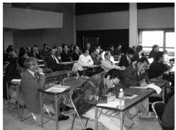
写真4 土づくり講習会 会場風景