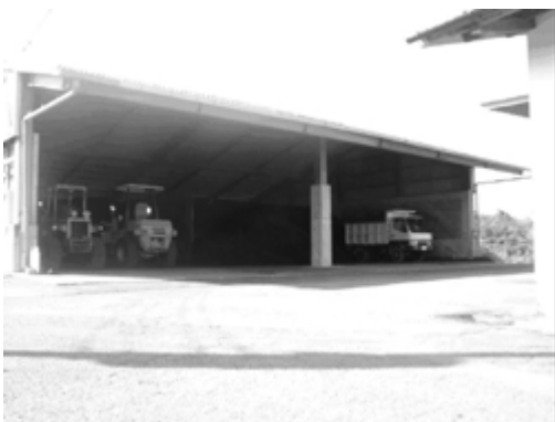
写真3 植物性残渣乾燥処理機 10[t/day]処理