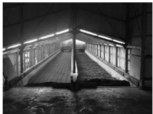
写真2 プラント舎 483[m 2 ](畜糞醗酵処理槽)