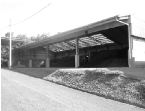
写真1 原料倉庫A 638[m 2 ](肥育牛原料倉庫)