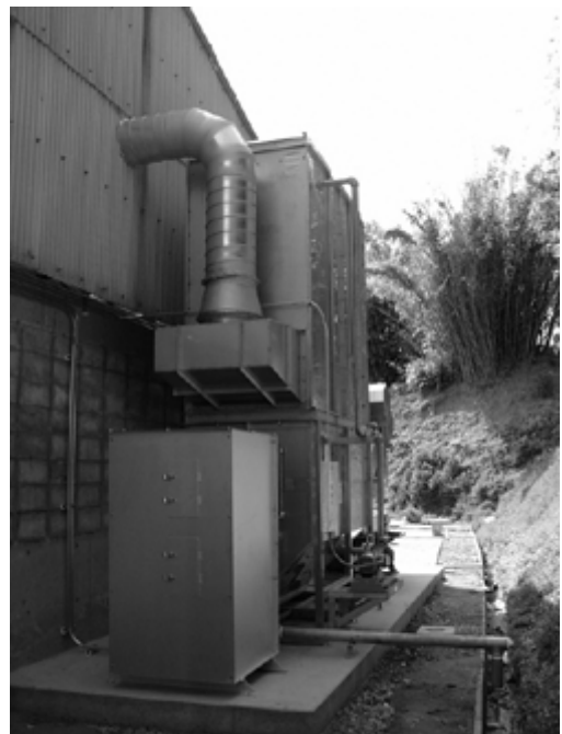
写真4 脱臭集塵スクラバー