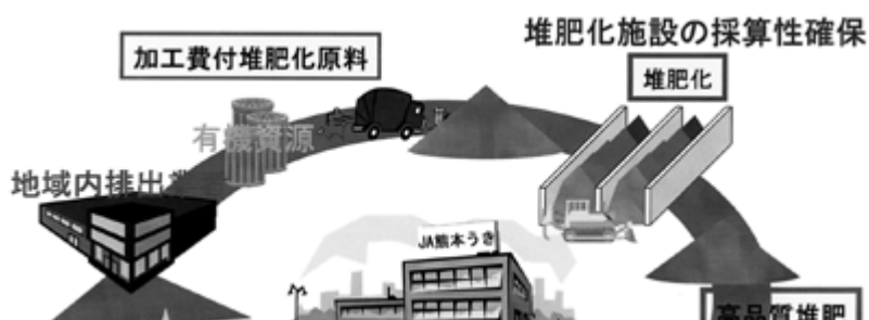
図2 有機資源循環に向けた法整備

堆肥加工費付きの堆肥原料の確保 有機資源循環の実践＝持続型農業への転進 高付加価値作物の生産と流通 地域密着型の農業経営へ(流通業界との連携)