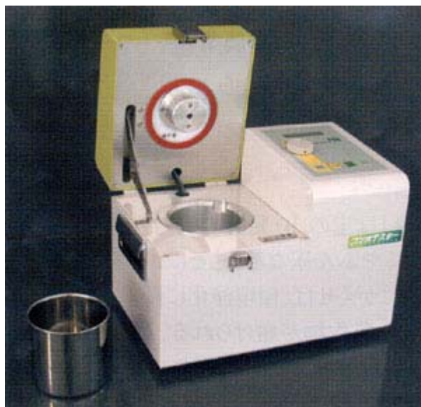
堆肥の熟度判定機「コンポテスター」

この原理にもとづく装置を富士平工業(株)との共同研究でコンパクトにまとめ、「コンポテスター」として製品化しました(写真)。