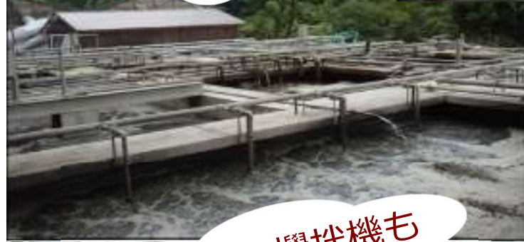
発酵舎・攪拌機も