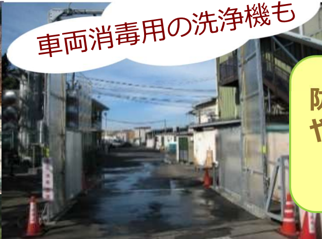
車両消毒用の洗浄機も